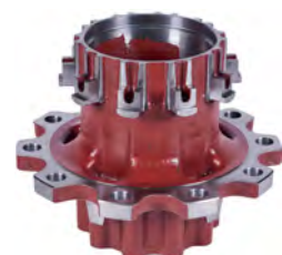
Radnabe mit Lager