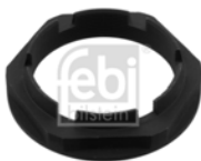
Achsmutter / Hinterachse