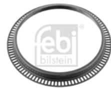
ABS Ring / Hinterachse